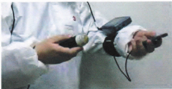
Uso en Porcino, Ovino y Caprino